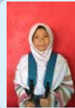
Nada Aurelia R.O. SDN Kanigaran 5 Kota Probolinggo