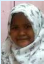
Nashita Raissa MI Baitur Rohim Gedangan - Sidoarjo