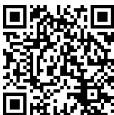
Pindai Versi Video