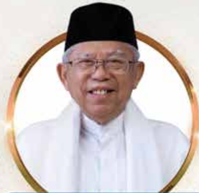
Prof. Dr. KH. Ma'ruf Amin*