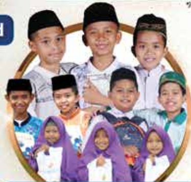
Anak Yatim Dhuafa Binaan Yatim Mandiri Seluruh Indonesia